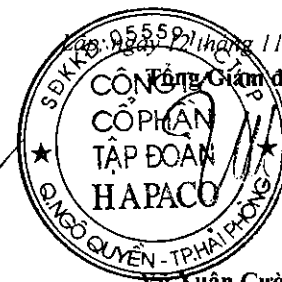
Vũ Xuân Cường